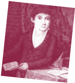
Donizetti de joven

1797 Gaetano Donizetti nace en Bérghamo, ciudad al norte de Italia. Aunque proviene de una familia numerosa (seis hijos) y humilde que no tiene dinero para sus lecciones musicales, el talento del joven es evidente desde temprana edad, a tal punto que Donizetti recibe una beca para estudiar música con el afamado compositor y profesor Simon Mayr en la catedral de Santa Maria Maggiore de Bérghamo.