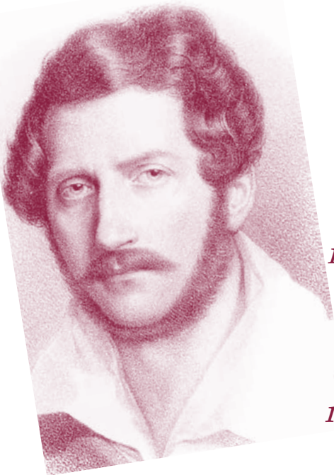
Donizetti de adulto

1828 Donizetti es nombrado director de los teatros reales de Nápoles, una posición que conlleva gran poder y prestigio. Aun así, sigue componiendo para muchas de las mayores óperas de Italia.