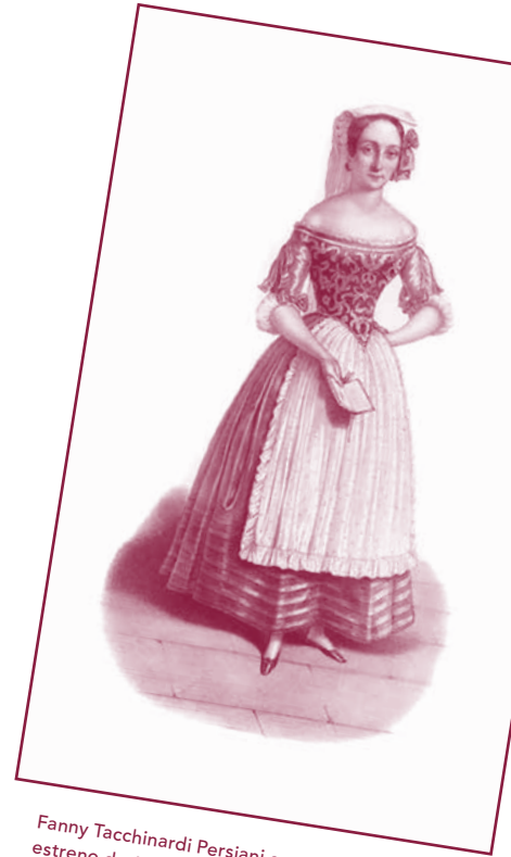
Fanny Tacchinardi Persiani como Adina en el estreno de 1839 en París