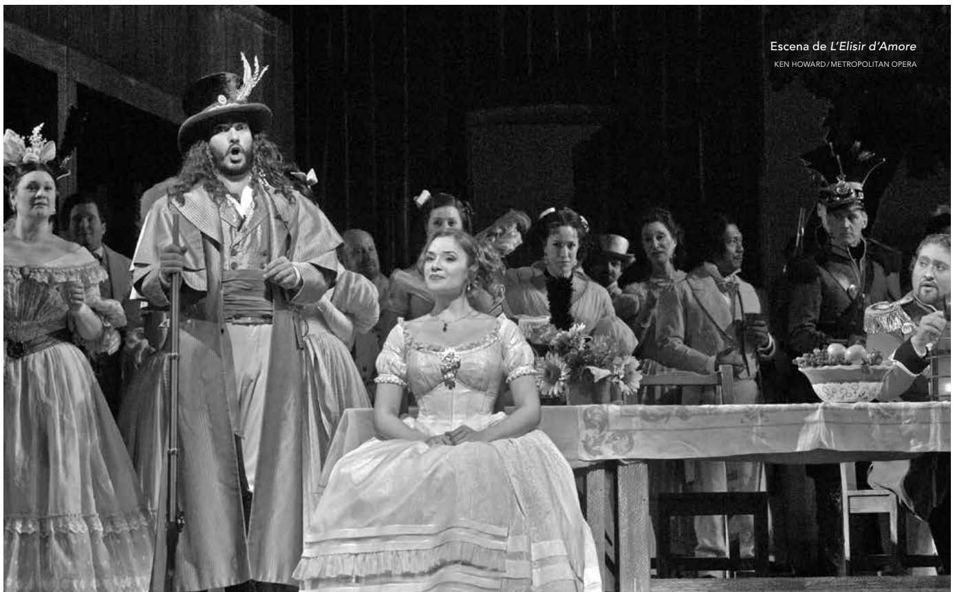
Escena de L'Elisir d'Amore

Llega a la plaza principal un majestuoso carruaje del que baja Dulcamara, un vendedor viajante, un charlatán que gana dinero vendiendo medicamentos falsos. El hombre anuncia que tiene una poción patentada que cura todo tipo de padecimientos. Mientras se oye el clamor de los crédulos pueblerinos que intentan comprar una botella, Nemorino llega a la plaza. El joven tiene el libro de Adina. Tímidamente, le pregunta a Dulcamara si vende la "poción de Isolda". Dulcamara dice que tiene un elixir que hace irresistible a quien lo beba, pero que tarda 24 horas en hacer efecto (para ese entonces, Dulcamara ya se habrá ido). Exultante, Nemorino gasta todo su dinero en una