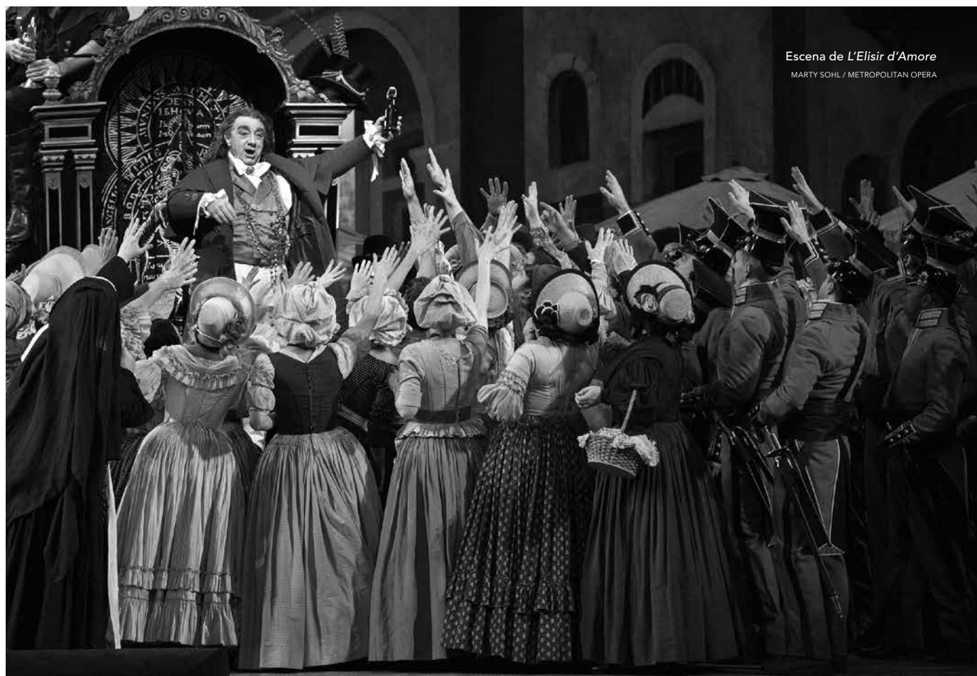
Escena de L'Elisir d'Amore

La gente del pueblo se reúne para el banquete de bodas. Adina aparenta estar feliz, pero oculta la tristeza que siente porque Nemorino no está allí. Nemorino busca a Dulcamara desesperadamente, pues espera que una segunda dosis de la poción haga que Adina se enamore de él antes de que se case con Belcore. Mientras tanto,