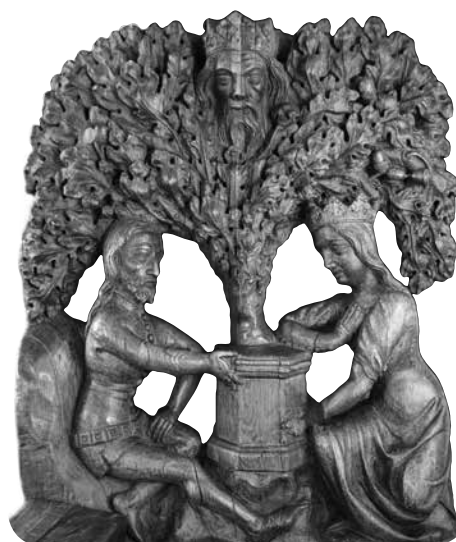
Representación en madera de Tristán e Isolda del siglo XIV en el ayuntamiento de Tallin, Estonia